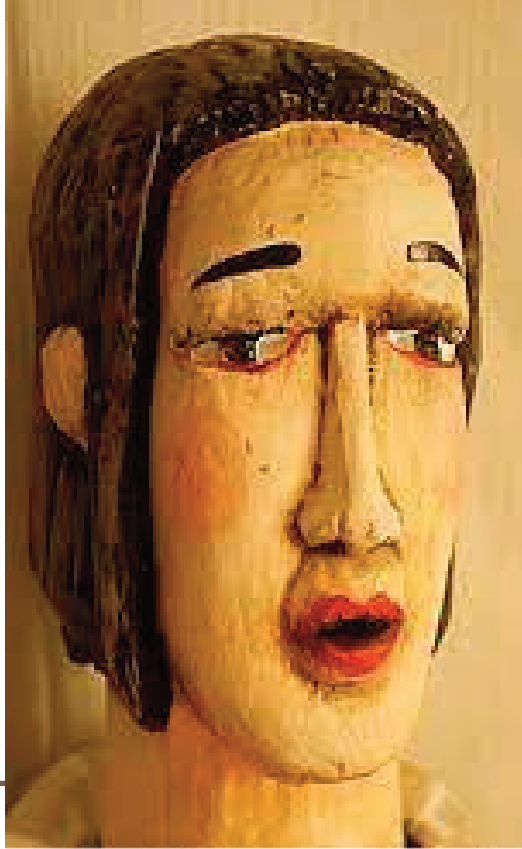
Leonce und Lena_Teatro Medico Ipnotico

21 MARZO 2022 – GIORNATA MONDIALE DELLA MARIONETTA