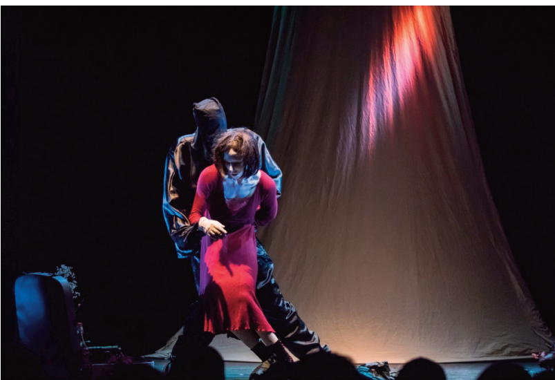
Riserva Canini, Talita Kum

https://www.facebook.com/events/485733956326185