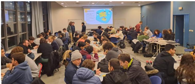
Innovation and Research Project (IRP)